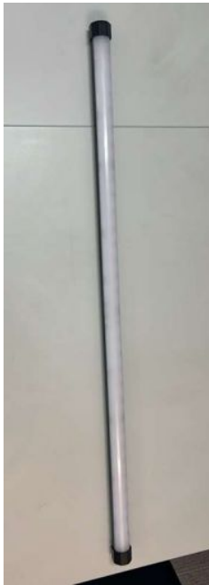
NANLITE PAVOTUBE II 30X