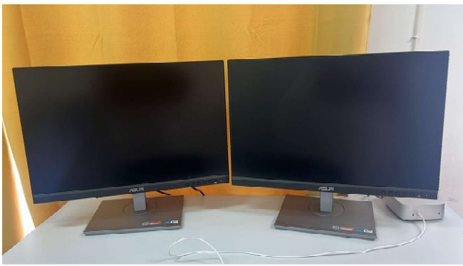
MONITOR ProArt PA248CNV