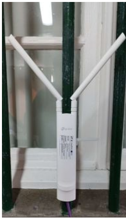
Access Point TP-LINK EAP225 AC1200 Outdoor