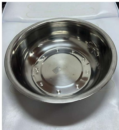
TAÇA PEDICURE 40CM