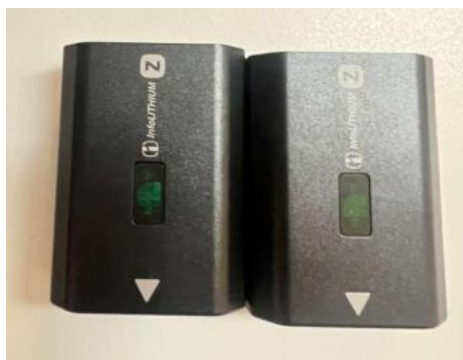
SONY BATERIA NP-FZ100