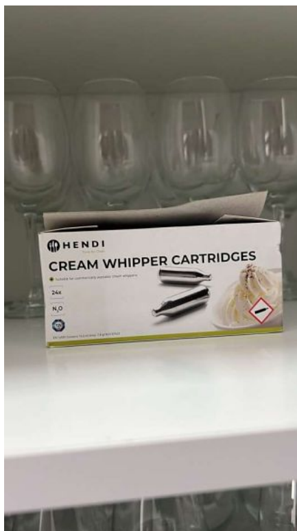
CARGA PARA SIFÃO