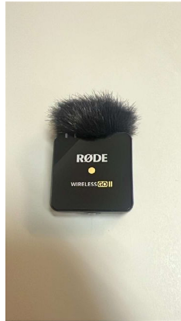
RODE WIRELESS GO III SINGLE SET