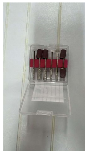
KIT ACESSÓRIOS SET MANICURE