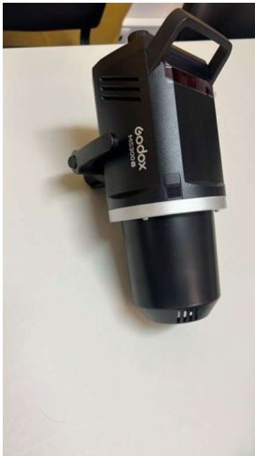
GODOX KIT FLASH MS300V-F (2XMS300) D243471