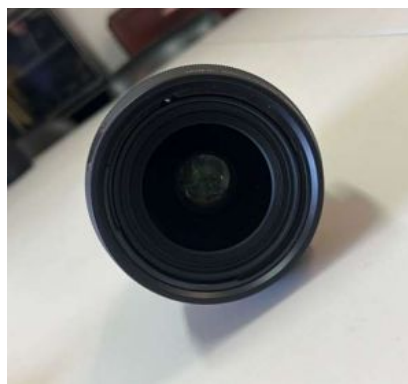
SONY CAMARA VÍDEO IMLE-FX30