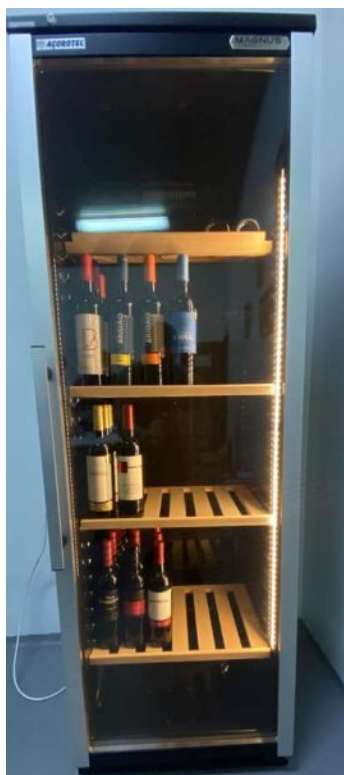
ARMÁRIO DE VINHOS WR-300-EM 72 GARRAFAS