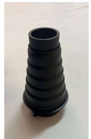
GODOX SNOOT SN01 –