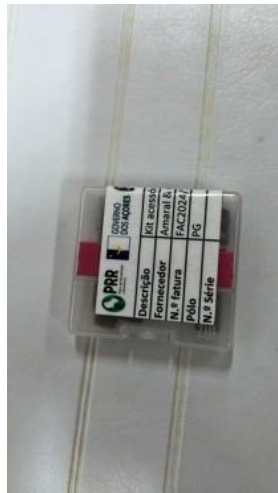
KIT ACESSÓRIOS SET MANICURE