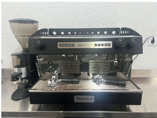
MÁQUINA DE CAFÉ CARAVEL