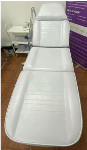
MARQUESA 3 CORPOS