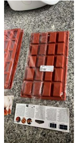
MOLDE LACOR PASTRY 20 CAVID