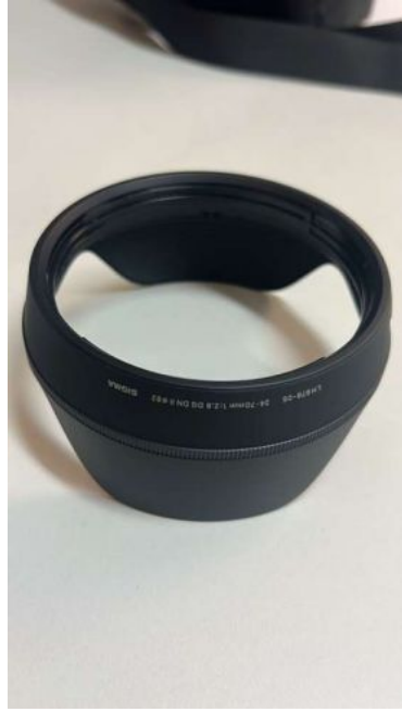
SIGMA OBJ.AF 24-70MM F2.8 DG DN II E-MOUNT