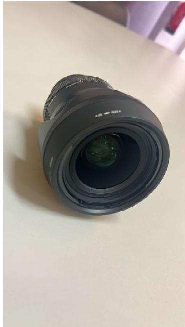
SIGMA OBJ.AF 35MM F1.4 DG DN | A-E MOUNT