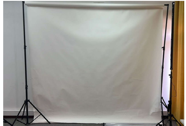
SAVAGE FUNDO PAPEL SUPER WHITE 2,72X11M