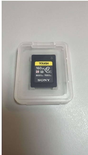
SONY CARTÃO CFEXPRESS TYPE A TOUGH 160GB