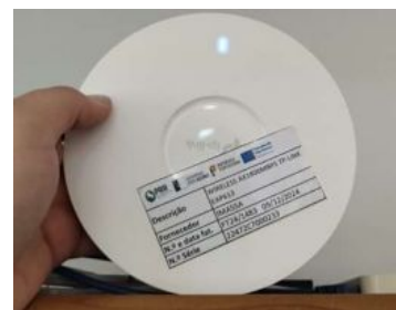
WIRELESS AX1800MBPS TP-LINK EAP613