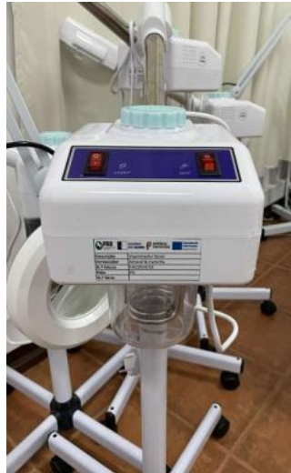
VAPORIZADOR FACIAL C/ OZONO