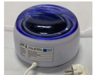
PANELA DE CERA 400GR