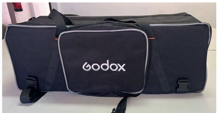
Mala da GODOX