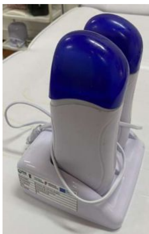
PUNHO DE ROL ON DUPLO