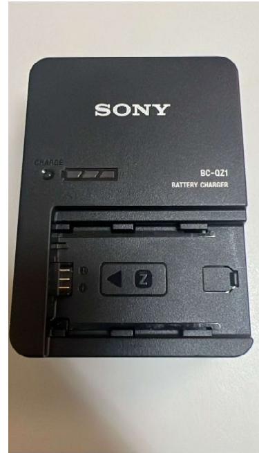
SONY CARREGADOR BATERIA BC-QZ1