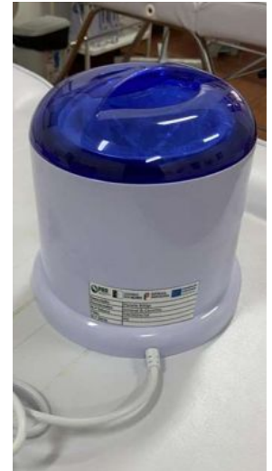
PANELA DE CERA 800GR