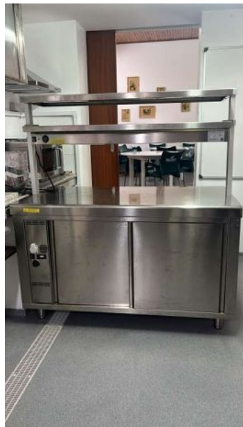
KIT AQUECIMENTO INFRA 1450 ALYAT