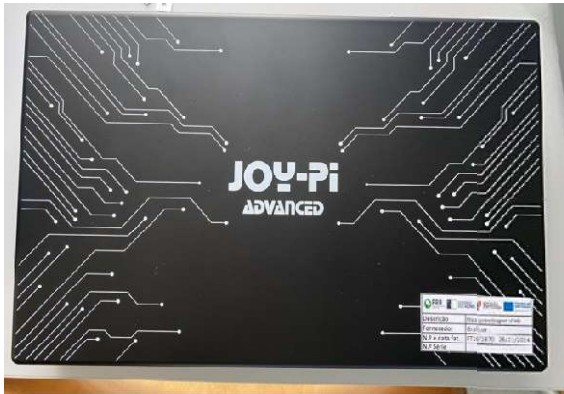
MALA DE APRENDIZAGEM E PROJETOS JOYPI