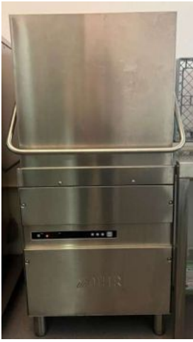
MÁQUINA DE LAVAR DE CAPOTA