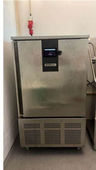
ABATEDOR DE TEMPERATURA