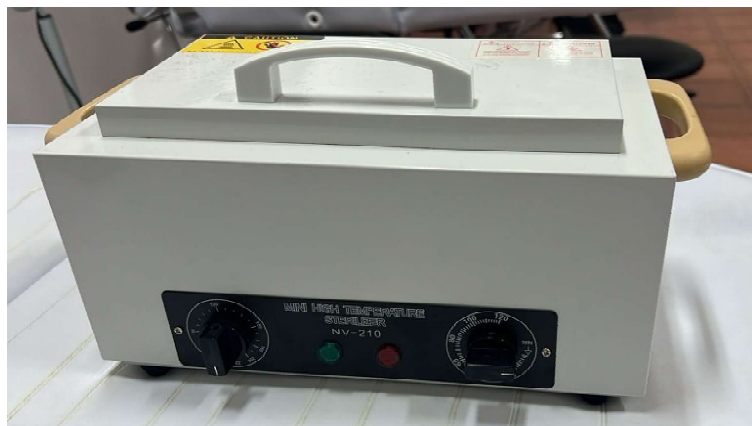
AUTOCLAVE A SECO ESTERILIZADOR