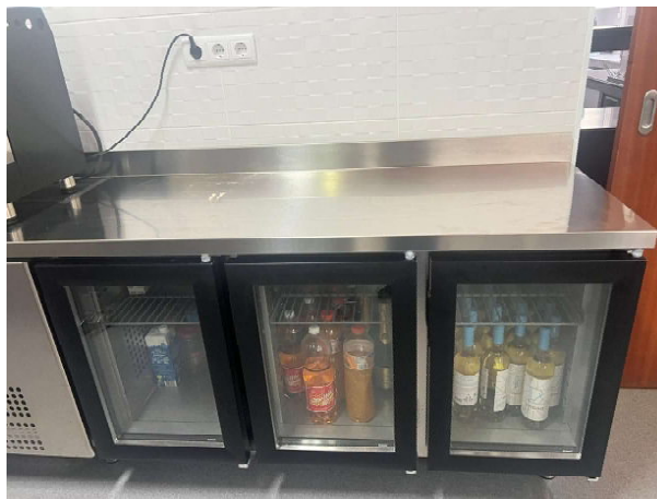
MESA REFRIGERADA MR