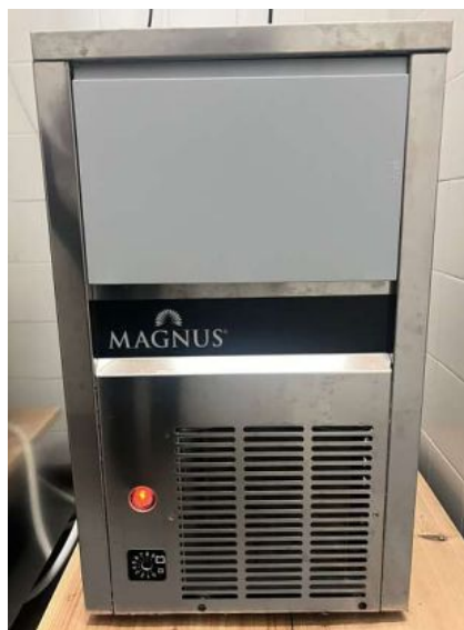
MÁQUINA DE CUBOS DE GELO