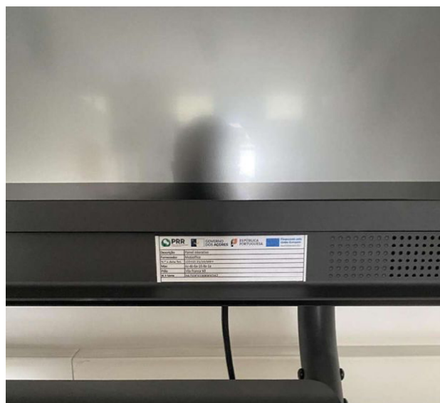
QUADRO INTERATIVO PROMETHEAN