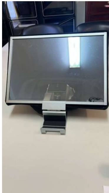
FEELWORLD TELEPROMPTER TP16