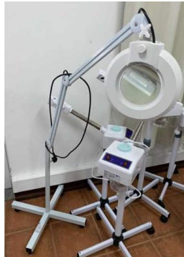
LUPA DE ESTÉTICA PROFISSIONAL