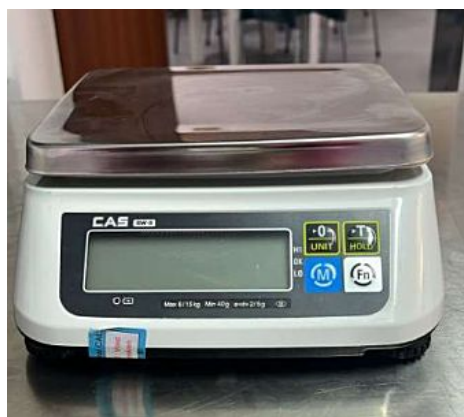
BALANÇA CAS MOD