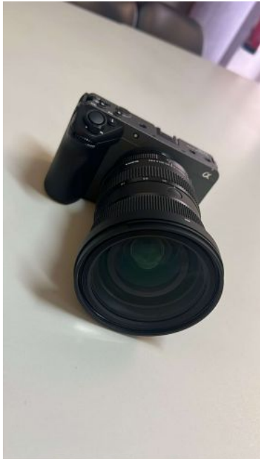
SONY MAQ.ALPHA 7 IV