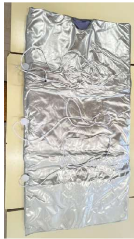
MANTAS DE SUCCÇÃO