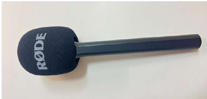
RODE INTERVIEW GO