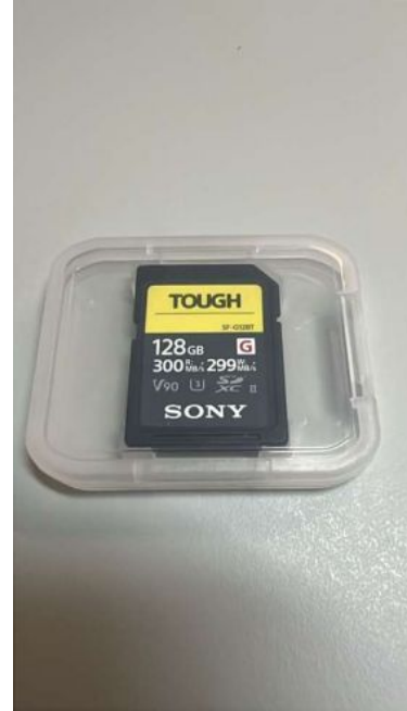
SONY CARTÃO SDHC UHS-III TOUGH R300 128GB