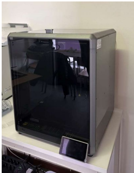
IMPRESSORA CREALITY 3D K1 MAX