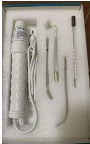
APARELHO DE ALTA FREQUÊNCIA