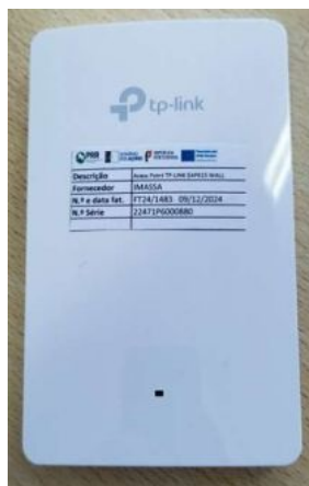
Access Point TP-LINK EAP615 WALL