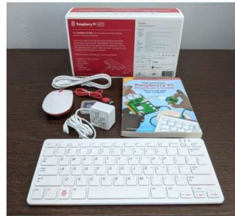
KIT COMPUTADOR RASPBERRY PI 400 (INTE. EM TECLADO PT) 1.8GH