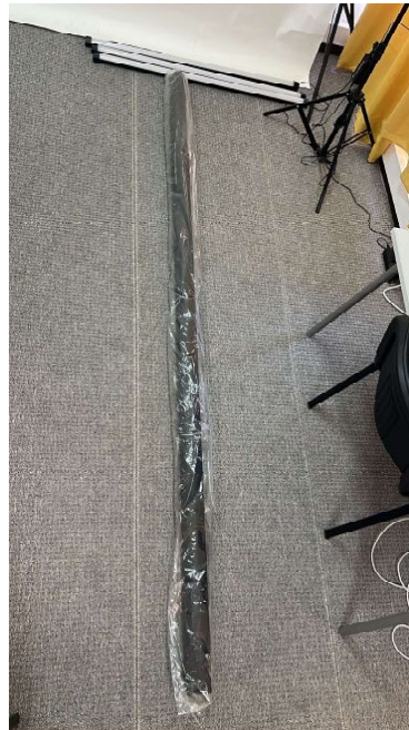
SAVAGE FUNDO PAPEL BLACK (20) 2,72MX11M