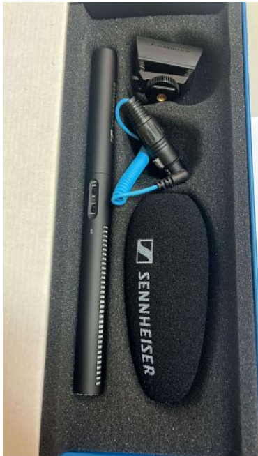
SENNHEISER MICROFONE MKE 600