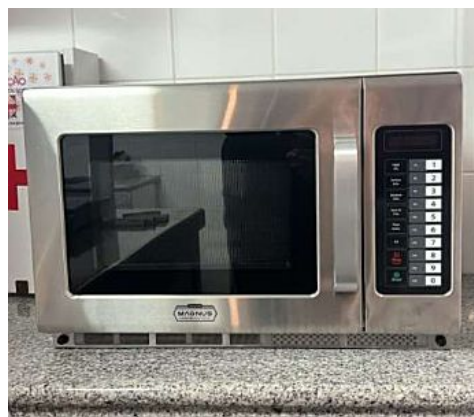
FORNO MICROONDAS PROFISSIONAL MAGNUS