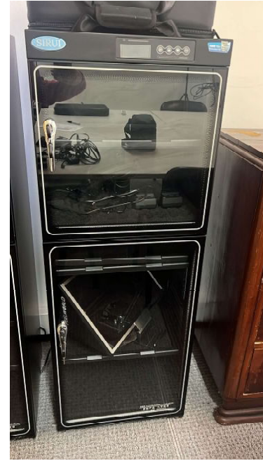
SIRUI CABINE CONTROLADORA HUMIDADE 200L HC-200