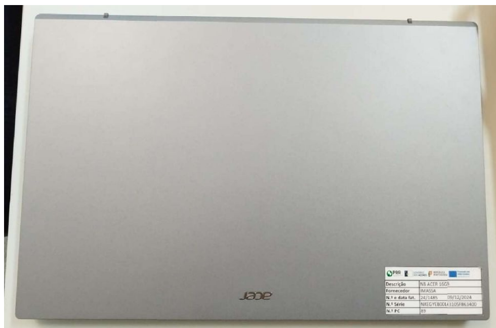
PORTÁTIL NB ACER 16GB