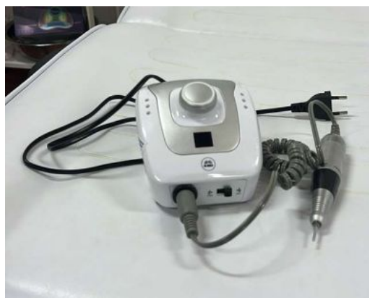
MÁQUINA PARA DESBASTAR GEL