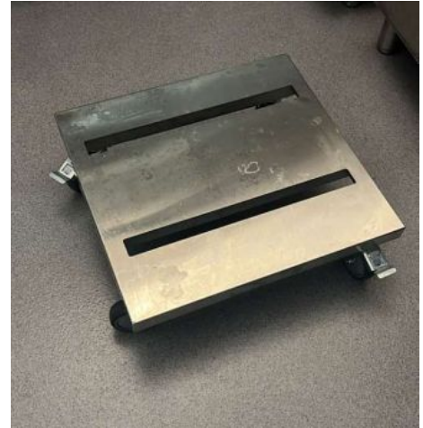
SUPORE COM RODAS 600X2