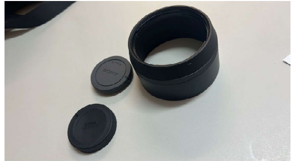
SIGMA OBJ.AF 85MM F1.4 DG DN | A-E MOUNT