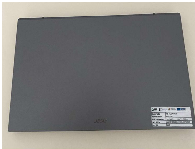
PORTÁTIL NB ACER 8GB