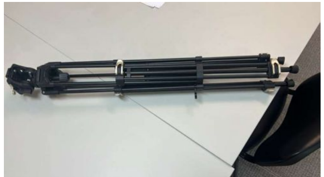
GODOX TRIPÉ GIRAFA DE ILUMINAÇÃO 420LB