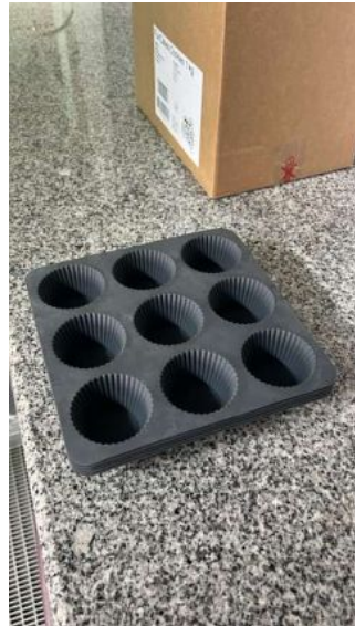
MOLDE LACOR CILINDRO 8 CAVID