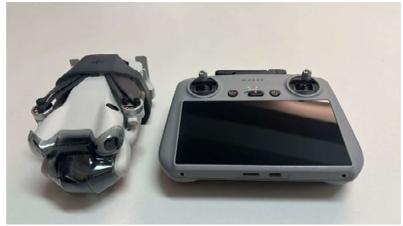
DJI MINI 4 PRO FLY MORE COMBO (RC-2)