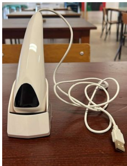
ANALISADOR DE PELE