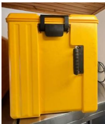
CAIXA TÉRMICA AVATHERM 600M