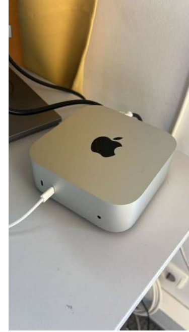
APPLE MAC MINI