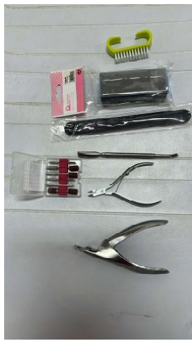
KIT ACESSÓRIOS SET MANICURE