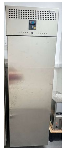
ARMÁRIO DE FRIGORÍFICO