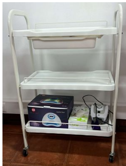
MESA ADJUDANTE ECO