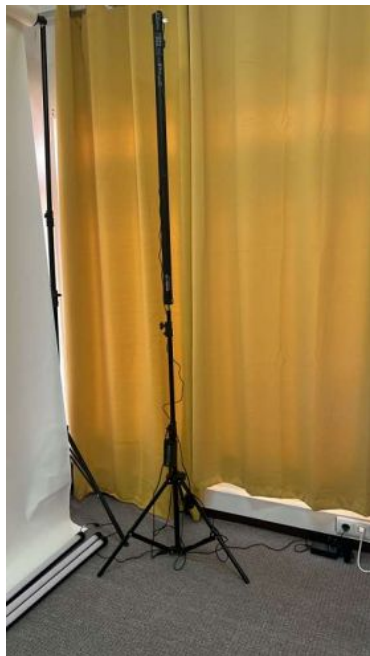
GODOX KIT SUPORTE FUNDOS BS04