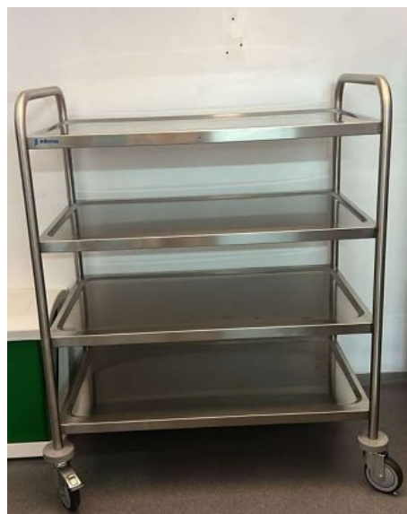
CARRO DE SERVIÇO 4 PRATELEIRAS