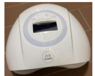
MÁQUINA LED 90W