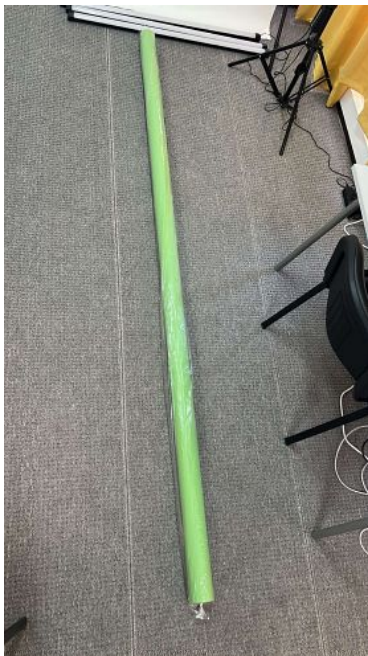
LASTOLITE FUNDO 2,72MX11M CROMAKEY LP9073