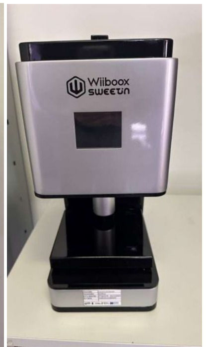
IMPRESSORA 3D ALIMENTAR WIIBOOX SWEETING