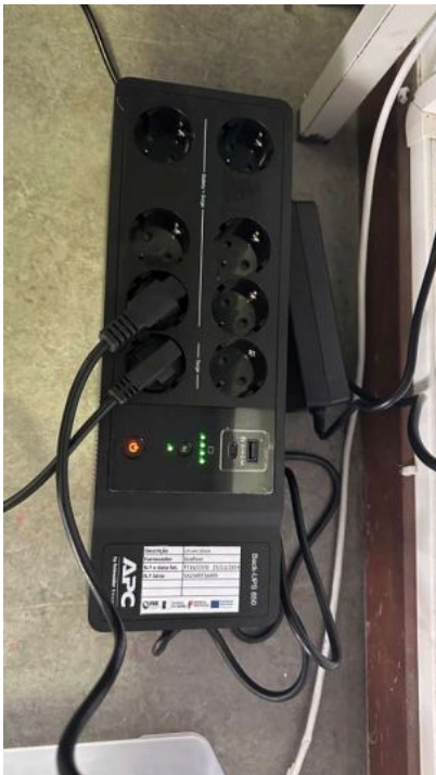
USP APC 850VA